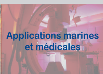
Applications marines et médicales