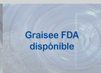
Graisse FDA disponible

Leader dans la fabrication des roulements et paliers en acier inoxydable, le Groupe ZEN vous propose une grande variété de produits, tels que: