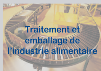
Traitement et emballage de l'industrie alimentaire